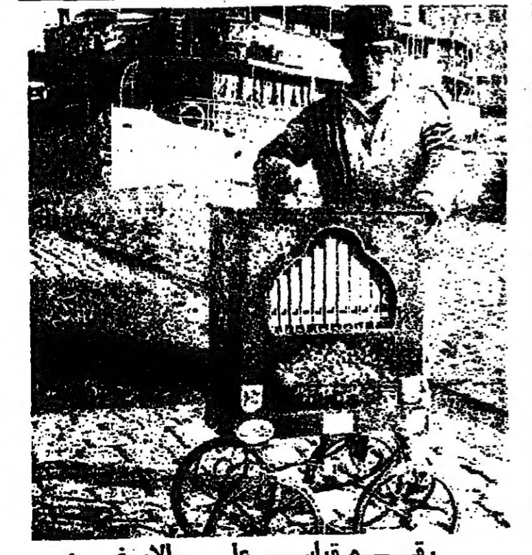
رقم قياسي على الأورغن

ولكنهم جميعاً سجناء . . . المصتص اعينهم بما بين ايديهم وما تحت ارجلهم ، لا يحولونها لحظة واحدة إلى ما فوق رؤوسهم ، أو إلى داخل انفسهم . حيث يستقر عقولهم وتدمم نهايتهم . قد اقلقت ذورهم طرق الغيب : اصمت فصلت ، واظلمت فتمطت . . . وما بقي لهم الا طريق الواقع المسود بالوت . انهم يجهون حساباتهم باصرار ، في الدنيا ان يرفخوا رؤوسهم . . . كالتلنج في المنية وحيدا ، برعوبا ، ويبد وحشته وخوفه بالصفير والفتاة الاجس ، تتجاول اصدائه بين اللسان والاذن والقلب ، وتزيد الظلمة والوحشة والرعب حضوراً وتكثفاً وسخراً ، الا انهم يرفخون رؤوسهم قليلاً . . . ثم يتساوون بينهم وبين انفسهم : ماذا خلقتا ؟ هل التي بنا في هذا